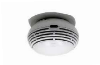
Option Sécurité (Détecteur Autonome Avertisseur de Fumée - DAAF)