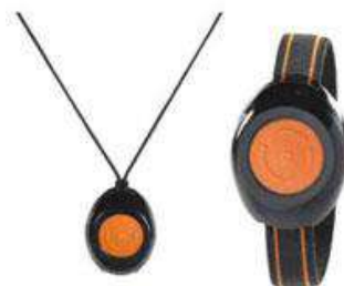
Déclencheur (en bracelet ou pendentif)