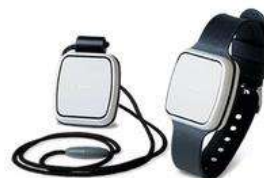
Option Sérénité (décteur de chute brutale)