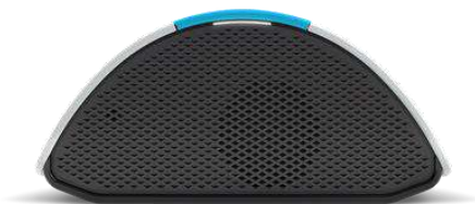
Transmetteur GPRS (boîtier de téléassistance)