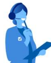
Option Convivialité (donne accès à notre service convivialité du lundi au vendredi de 9h à 12h et de 14h à 18h, qui pourra orienter l'abonné vers notre service de soutien psychologique si besoin)